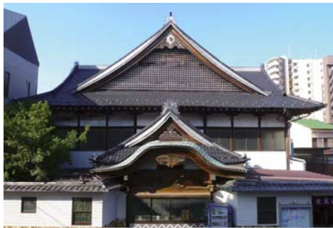
銭湯の重厚な外観

銭湯は、お金を払って利用する公衆浴場のことで、だれでも、そして決められた利用期間・時間の中でならいつでも利用することができます。ただし、多くの人が同時に利用しますから、いくつかのマナーを守ることがとても大切です。それらを守ることで、楽しく快適に銭湯を利用していただきたいと思います。